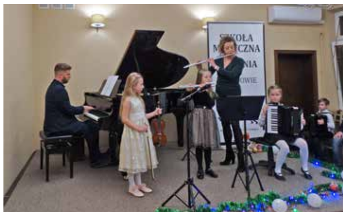
Koncert Kolęd 13.01.2023 r.

W dniu 13.01.2023 odbył się w naszej auli Uroczysty Koncert Kolęd. Poprzedził go cykl kolędowych popisów poszczególnych klas instrumentalnych oraz zespołów rytmicznych, instrumentalnych i wokalnych. W klasowych popisach wystąpili niemal wszyscy uczniowie. Natomiast w Koncercie Uroczystym wybrani wykonawcy i zespoły. Sala pękała w szwach, na korytarzu ustawiono dodatkowe krzesła, aranżując kolejną scenę i miejsca dla widzów, a muzyka