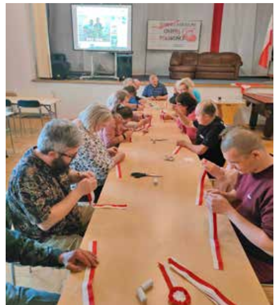
Warsztaty – symbole narodowe

doskonale zna rynek tej branży. Wykładowca przekazywał swoim słuchaczom zarówno wiedzę teoretyczną jak i praktyczną w zakresie porządkowania. Uczestnicy poznawali fach począwszy od zasad bhp do praktycznego zastosowania chemii czyszczącej i specjalistycznego sprzętu. Przekazana wiedza będzie z pewnością przez nich wykorzystana w gospodarstwie domowym a być może któryś z uczniów podejmie pracę w zawodzie. Trzymamy kciuki.