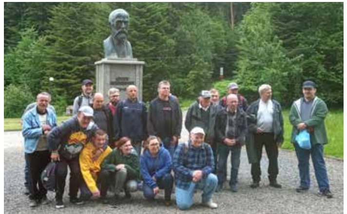
Muzeum Przemysłu Naftowego i Gazowego im. Ignacego Łukasiewicza

Druga 11 osobowa grupa odbyła natomiast przeszkolenie w zawodzie pracownik gospodarczy. Szkolenie, realizowane w okresie od 11 do 25 maja prowadził właściciel firmy sprzątającej, który