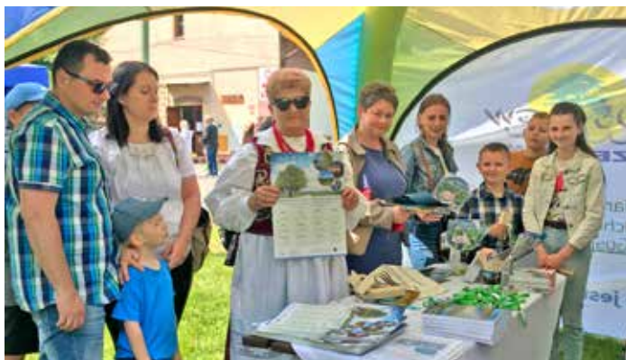
Stragan Ekologiczny