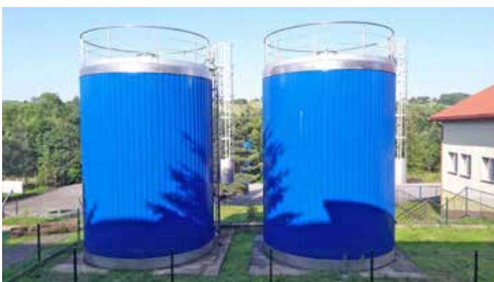
Nowe zbiorniki wody uzdatnionej na SUW w Dynowie