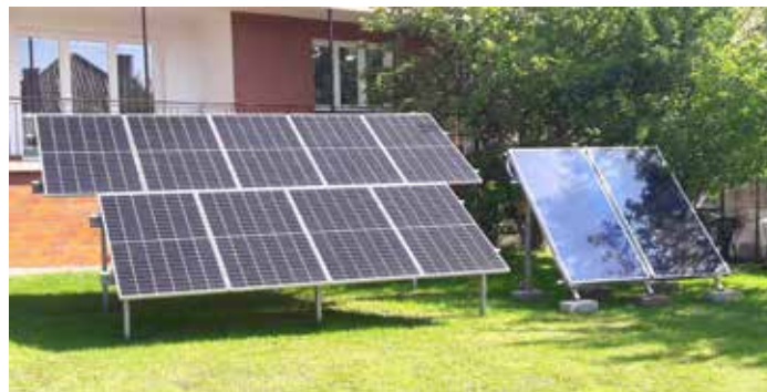
Instalacja fotowoltaiczna i kolektory słoneczne na gruncie