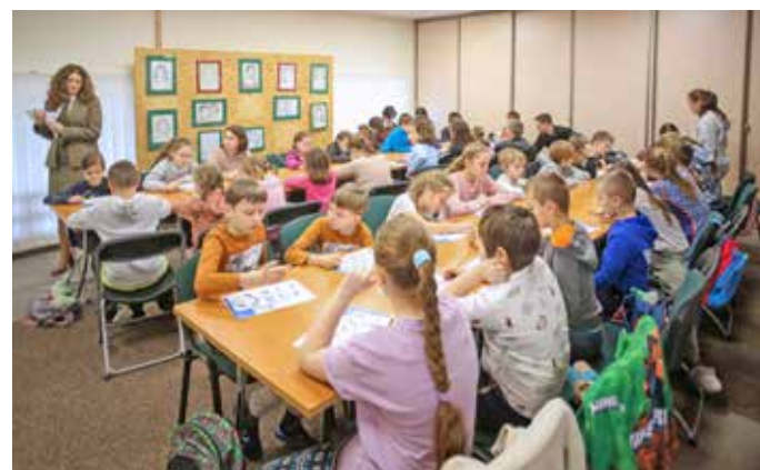
Ferie 2023 w bibliotece