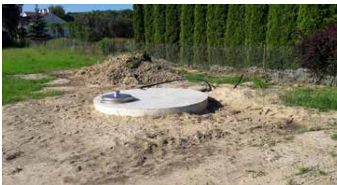
Budowa wodociągu w Dynowie (hydrofornia)

Wartość robót budowlanych wraz z nadzorem inwestorskim: 3 625 900,00 zł, w tym dofinansowanie ze środków krajowych w ramach Rządowego Funduszu Polski Ład: Program Inwestycji Strategicznych w wysokości 2 891 000,00 zł, udział środków własnych Miasta Dynów w wysokości 734 900,00 zł.