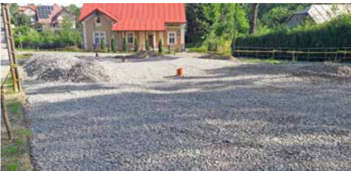
Parking ul. Jana Pawła II

dowę parkingu w dniu 05.05.2023 r. Gmina Miejska Dynów zawiadomiła Powiatowego Inspektora Nadzoru Budowlanego w Rzeszowie o planowanym rozpoczęciu robót związanych z budową parkingu. Wykonawcą robót jest Zakład Gospodarki Komunalnej w Dynowie. Roboty rozpoczęto w dniu 22.05.2023 roku od rozbiórki budynku handlowego. Aktualnie prowadzone są prace ziemne i wykonanie podbudowy parkingu z kruszywa. Prace ziemne prowadzone są pod nadzorem archeologicznym, wymaganym przez Wojewódzkiego Konserwatora Zabytków.