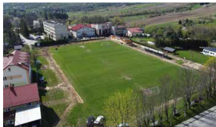
Trwające roboty budowlane