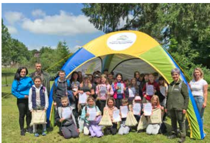
Zajęcia terenowe