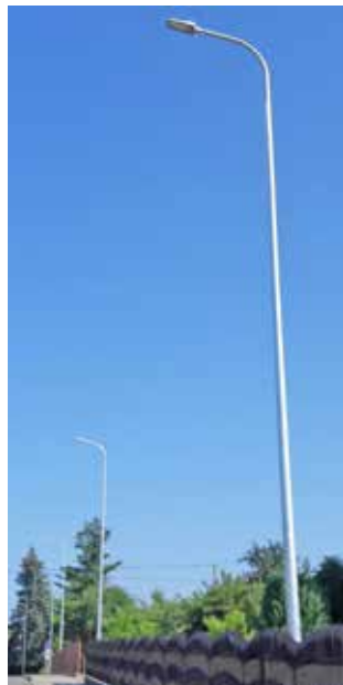
Oświetlenie ul. Jana Pawła II

W dniu 21.02.2023 r. przekazano plac budowy. Aktualnie prace trwają na ul. Źródlanej, ul. Błonie, drogach bocznych do ul. Polnej oraz prace oświetleniowe przy ul. Grunwaldzkiej, ul. 1 Maja, ul. Jana Pawła II, ul. Dworskiej. Stan zaawansowania realizacji inwestycji szacowany jest na około 25 %.