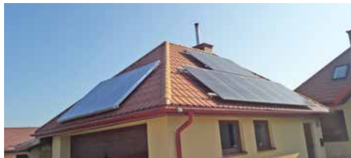
Instalacja fotowoltaiczna i kolektory słoneczne na dachu budynku gospodarczego

Zamontowano 126 kompletów instalacji fotowoltaicznych oraz 81 kompletów instalacji kolektorów słonecznych. Dokonano odbiorów rzeczowych powyższych instalacji. Aktualnie grupy montażowe dokonują likwidacji usterek oraz poprawek jakie zostały wykazane podczas odbiorów rzeczowych instalacji. Równolegle trwają wymiany liczników energii elektrycznej przez PGE Dystrybucja S.A. na liczniki dwukierunkowe. Rozliczenie końcowe projektu planowane jest na przełom miesięcy lipiec-sierpień 2023 r.