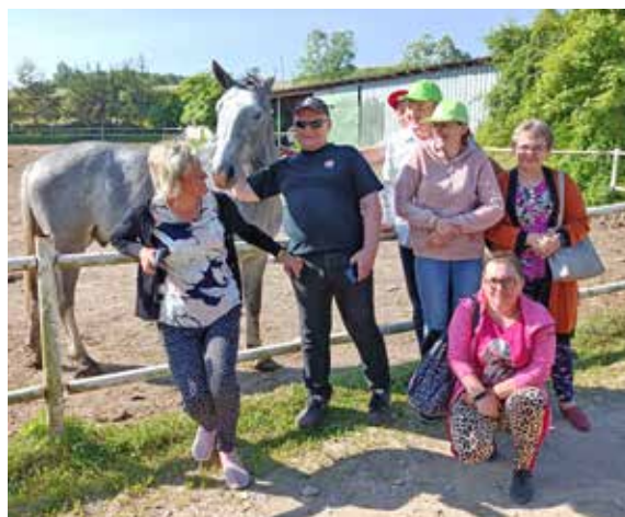
Ośrodek jeździecki w Wysoczanach

Jazda konna to idealne połączenie sportu i rekreacji na świeżym powietrzu. Naszym jeźdźcom tak bardzo spodobał się wyjazd, że ciągle powtarza się pytanie: Kiedy znowu pojedziemy na hipoterapię? Co potwierdza że kolejny wyjazd należy uznać za udany.