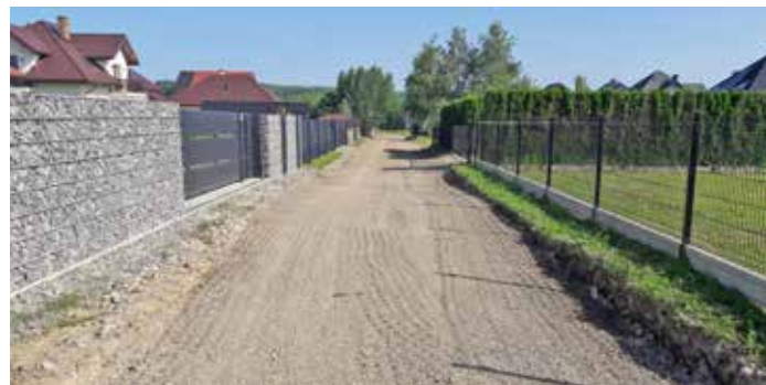
ul. Słoneczna (droga boczna do ul. Polnej)