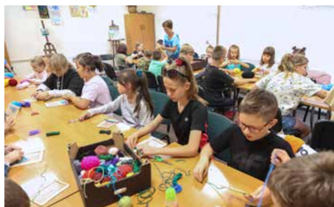
Wakacje 2023 w bibliotece