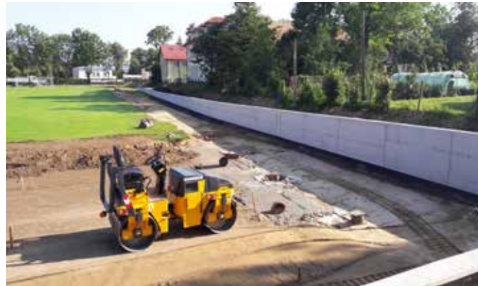
Trwające roboty budowlane związane z wykonaniem muru oporowego i drenażu boiska